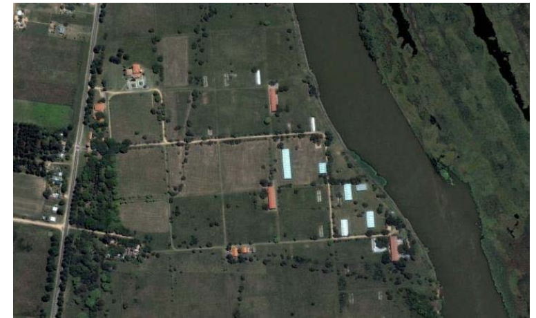
Foto satelital Google Earth de Santa Fe la Vieja

Hoy la importancia de Santa Fe la Vieja es reconocida a nivel nacional e internacional como testimonio significativo de las ciudades hispanoamericanas en los primeros tiempos de la conquista y colonización. El sitio ha sido declarado Monumento Histórico Nacional por decreto nro. 3129 del 25-03-1957. Las características del sitio lo han convertido en un referente ineludible de la arqueología histórica argentina y americana. Sus posibilidades didácticas despiertan interés entre visitantes de diversas edades, niveles de formación y procedencia ya que es un recurso valioso para comprender y dimensionar la vida urbana en los primeros tiempos del proceso de conquista y colonización de América.